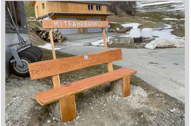
Veulden à ussa egn banc da cunviagear.

Egn cumember da la Pro Feldis à proponieu da drizar egn banc da cunviagear.